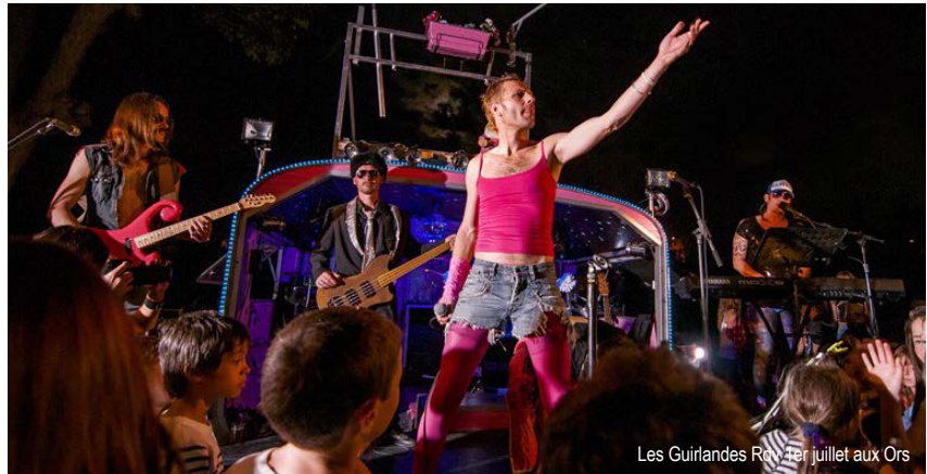
Les Guirlandes Revue 1er juillet aux Ors

Dans le parc paré d'ors grâce à de vaillantes couturières, un grand jeu créé spécialement pour l'occasion (chuuut, surprise...) vous attend. Photos et anecdotes des 30 dernières années seront au rendez-vous, l'occasion de se rappeler d'où nous venons... et de nous demander où nous allons ! Que faire bouger aujourd'hui ? Que voulons-nous pour les 30 prochaines années aux Ors ? Après le repas et le grooooo gâteau d'anniversaire, le groupe «Les Guirlandes» sera là avec sa caravane pour vous faire danser jusqu'au bout de la nuit !